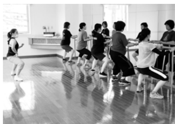
(一社) 日本マタニティフィットネス協会 協会HP→ https://www.j-m-f-a.jp [MEDEX Journal Vol.221] 2021年11月号より