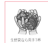
生野菜なら両手1杯