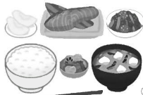
白米160g (例) 妊娠前の1日1900kcalの食事