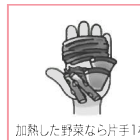
加熱した野菜なら片手1杯